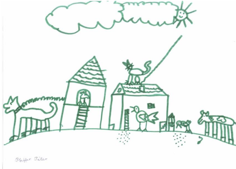
A mi udvarunk

Hozzájárulni ahhoz, hogy a gyermekek az óvodáskor végére hagyományait és környezetét ismerő és tisztelő, környezetével kiegyensúlyozott viszonyban élő, a fenntartható életmód iránt nyitott, embertársait szerető felnőttekké váljanak.