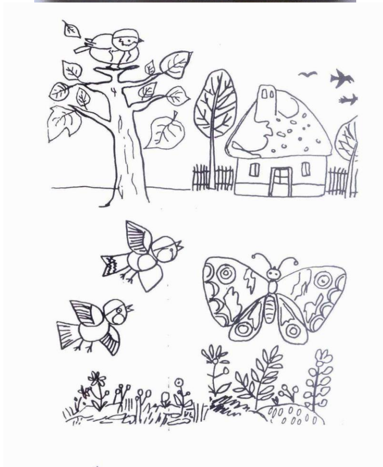
Az 1998-ban bevezetett program címlapja és belső oldala